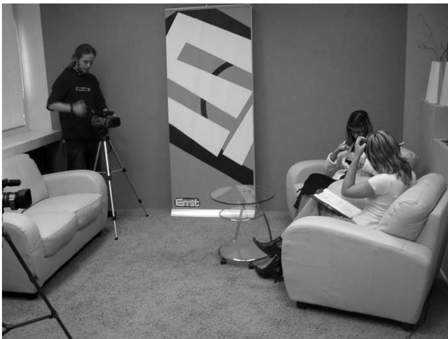
Studio telewizji EMIT podczas przygotowań do nagrania

„Na sofę”, czyli sztandarowy program telewizji EMIT, gościł już podróżników, muzyków, nauczycieli elbląskich szkół, fotografików, dziennikarzy. Qbi