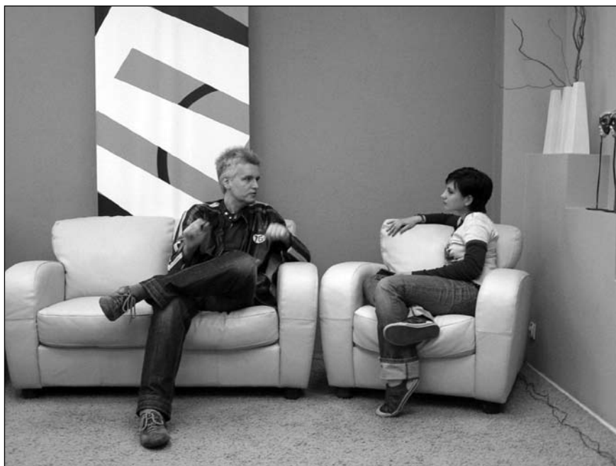
Nagranie sztandarowego programu EMIT-u, czyli talk-show „Na sofę”

– Być może wkrótce będziemy dostępni w Internecie. A tą drogą dotrzemy już do najdalszych zakątków całego świata – planuje Jola. ■