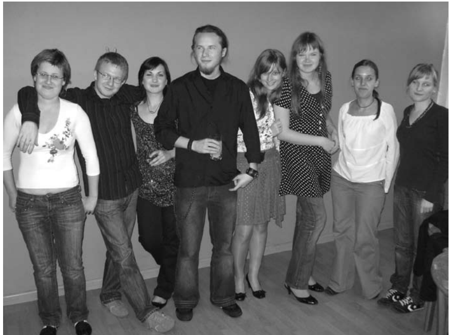
Współtwórcy filmów zrealizowanych w ramach „Aktywizacji międzygeneracyjnej”

– Zależało mi, aby starsi ludzie nie musieli siedzieć wciąż przed telewizo-